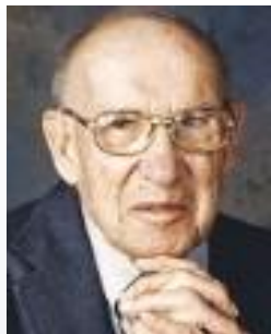
Peter Drucker (1909~2005)